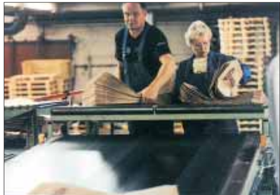
Pyrollsack Oy, Karhula