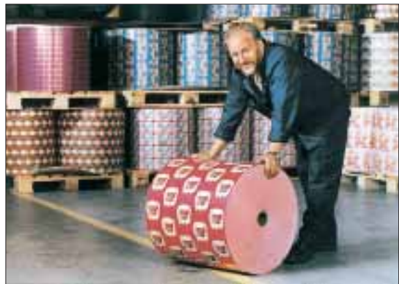
Pyrollpack Oy, Lempäälä

Pyroll Groupin kehitykseen on liittynyt voimakas kasvu sekä yritysten laajentumisen myötä että yritysoston johdosta. Viimeisin tulokas yritysryppäeseen oli tänä vuonna ostettu Karhulan paperisäkkitehdas, Pyrollsack Oy. Se sopii sijainniltaan ja tuotannoltaan hyvin Pyrollin yritysperheeseen. Lähes puolet Suomen paperisäkeistä tehdään Karhulassa.